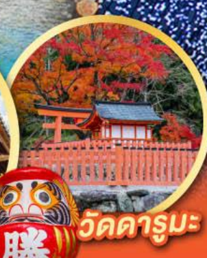
วัดคารุมะ