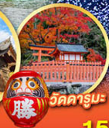
วัดคารุมะ