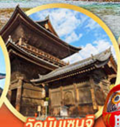
วัดนินเซินจิ