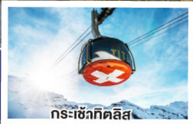
กระเช้าทิลิส