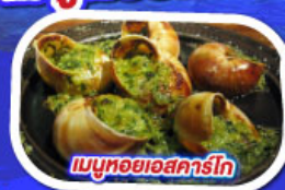
เมนูหอยแอสคาร์โท