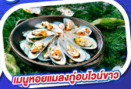
เมนูหอยแมลงภู่อบไวน์ขาว