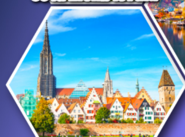
อุล์มบ้านเกิดไอน์สไตน์