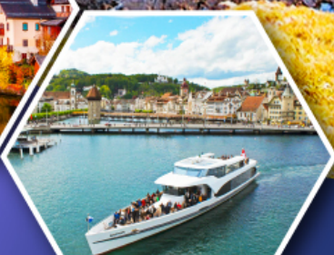
ล่องเรือทะเลสาบลูเซิร์น