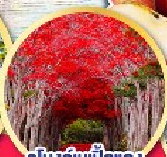
อุโมงค์เมเปิ้ลแดง ณ สวนลับฮิราโอเกะ