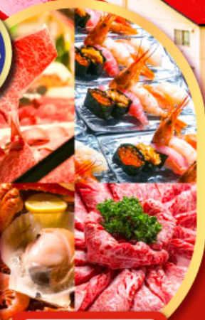
พิเศษ!! บุฟเฟ่ต์ร้าน NANDA ดีที่สุดในชิปปิโร