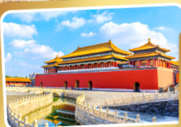
พระราชวังโบราณกู้กง