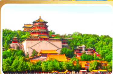
พระราชวังฤดูร้อนอี๋เหอหยวน