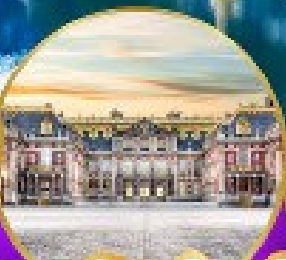
พระราชวังแวร์ซายส์