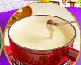
ฟองดูซีส