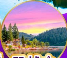
ทิกเกเซ่ ปาดำ