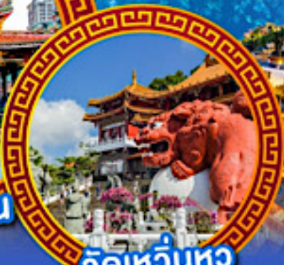
วัดเหวียนหวู