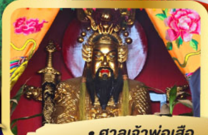
• ศาลเจ้าพ่อเสือ