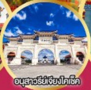
อนุสาวรีย์เจียงไคเช็ค