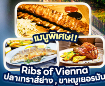
เมนูพิเศษ! Rib's of Vienna ปลาเทราสย่าง, บาหมูเยอรมัน