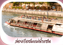
ล่องเรือชมแม่น้ำแซน