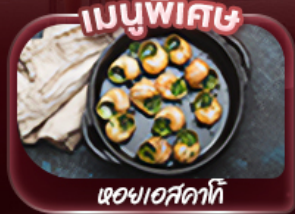
หอยแอสคาทิ