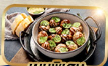
เมนูพิเศษ หอย Escargot