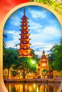
วัดเงินทิวัก