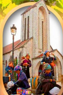
โบสถ์หินซาปา