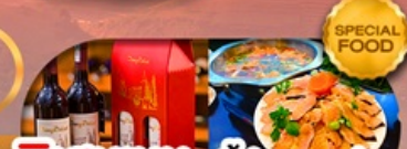
พิเศษเมนู สุกี้ปลาเซลม่อน ลิ้มรสไวน์แดงชื่อดัง เดินทาง ต.ค. 69 เป็นต้นไป