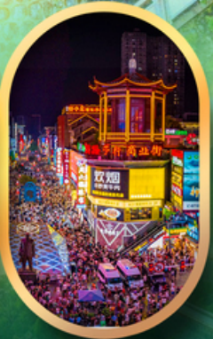
ถนนคนเดินซิงลู่