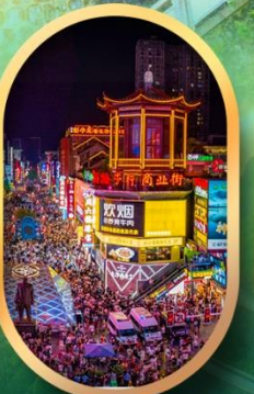
ถนนคนเดินซิงลู่