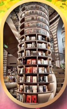
อุทยานปีผิงโกว