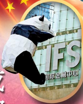
IFS หมีแพนด้าปิ่นดิก