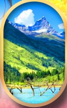
อุทยานสีดรุณี