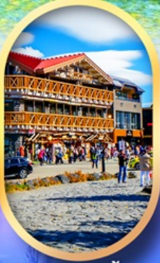
ภูเขาไฟฟูจิ ชั้น 5