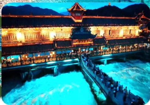
เมืองโบราณตุเจียงเหียน