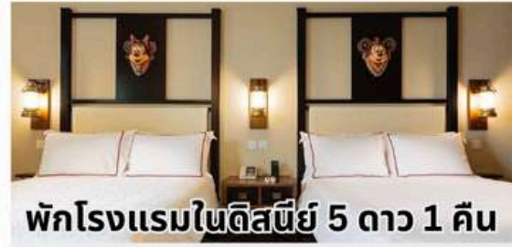
พักโรงแรมในดิสนีย์ 5 ดาว 1 คืน