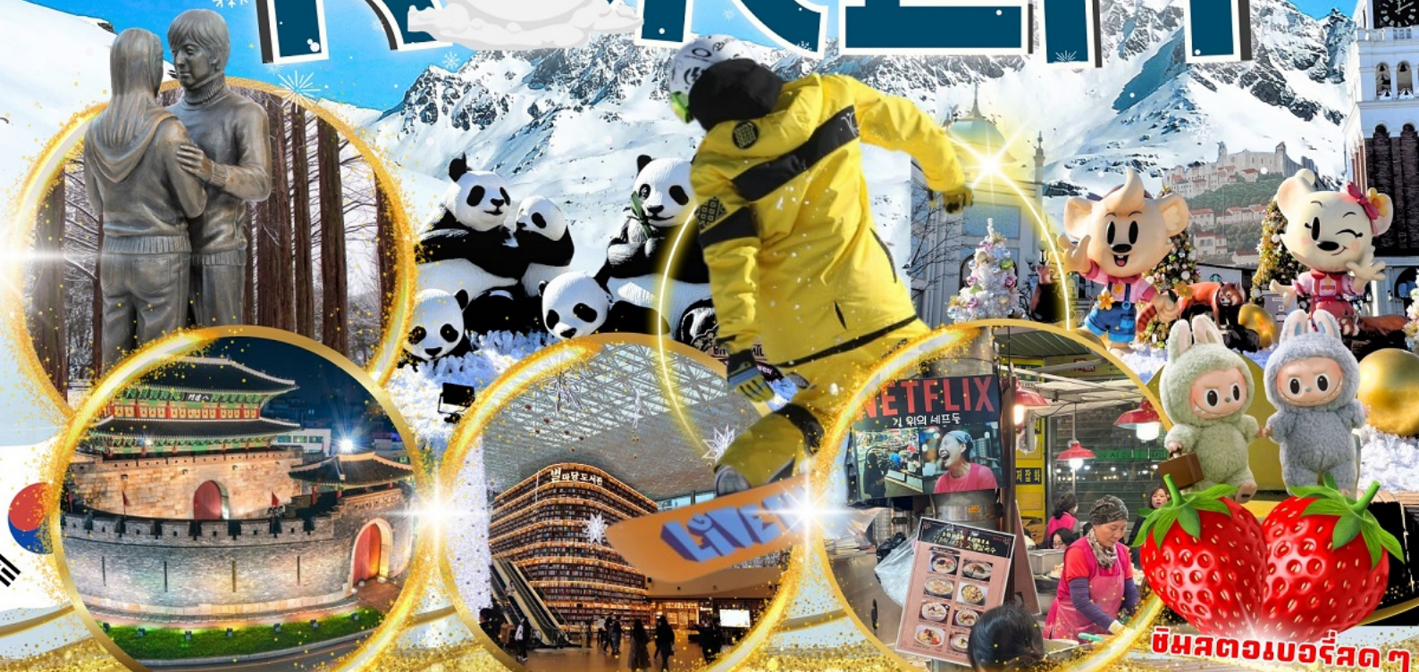
ป้อมฮวาซอง