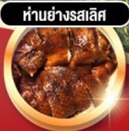
ห่านย่างสลีส