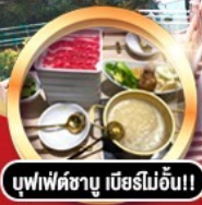
บุฟเฟ่ต์ชาบู เมียร์โมอัน!!