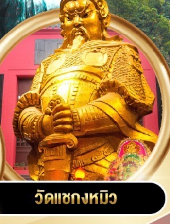
วัดแชกงหมิว