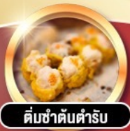
ติ่มซำต้นตำรับ

การ์ตูนดี!! พักหรู 4 ดาว PRUDENTIAL HOTEL ติดถนนนาธาน ย่านช้อปปิ้งจิมซาจู้