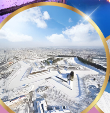
ป้อมโทเรียวคาคุ