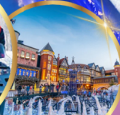
โรงงานช็อคโกแลต ชิโรอิ โคอิมีโตะ