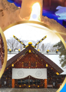
ศาลเจ้า ออกโทโต

เดินทาง 04 - 09 กุมภาพันธ์ 68 05 - 10 กุมภาพันธ์ 68 06 - 11 กุมภาพันธ์ 68