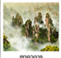
ศาลอวตาร