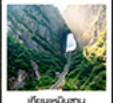
เทือกเขินฮินฮัน

แอร์ไลน์คอนยอน / สนามกีฬากว๋างโจว / เขาสินหนิงฮาน / ไร่เมืองแก้ว / ประตูสวรรค์ / ไร่มังกรจิ้งจอกขาว / เขาสินฮิงฮาน สวนจอนหวงเผิงต๋อง / ภาพวาดทราย / เมืองฟูหลงเจิน / ล่องเรือตามลำน้ำต๋อเจียง / เขามือโบราณฝ่งหวงยกน้ำดื่ม