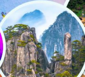
ภูเขาหวงซาน