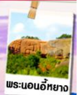
พระนอนอียาง