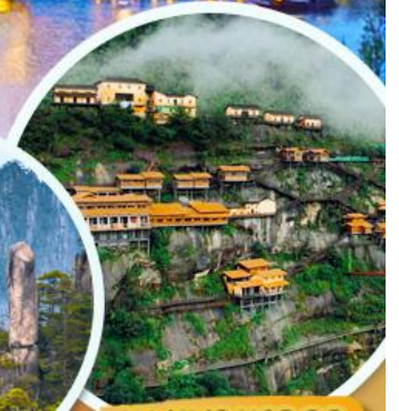
หุบเขาเทวดา

เมนูพิเศษ!! เปิดปักกิ่ง หมูแดง ปลาหมึกเป็ยร้อฮยาง