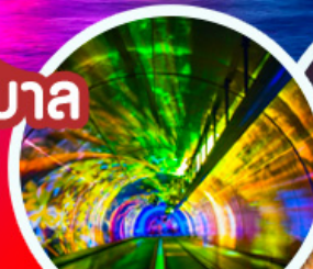
จูโมงค์เลเซอร์