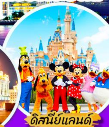
ดิสนีย์แลนด์

***เมนูพิเศษ : เสี่ยวหลงเปา , ชาบูหม่าล่า *** เที่ยวแบบสบายๆ ไม่ลงร้านรัฐบาล ***