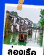
ล่องเรือ