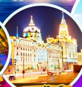
เดอะบันด์