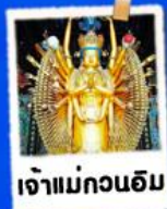
เจ้าแม่กวนอิม