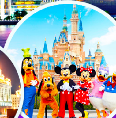
ดิสนีย์แลนด์