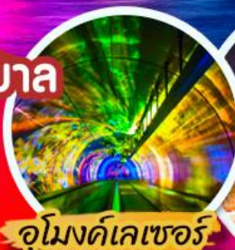
จูมงค์เลเซอร์