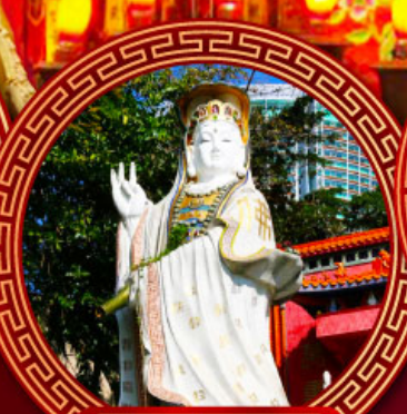
เจ้าแม่กวนอิม รีพัลส์เบย์