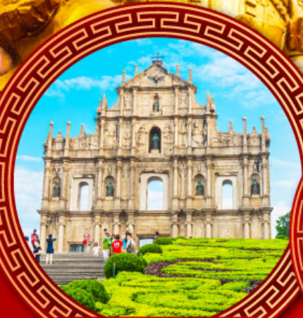
โบสถ์เซนต์ปอล