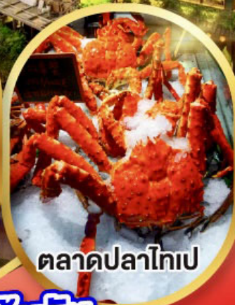
ตลาดปลาไทเป