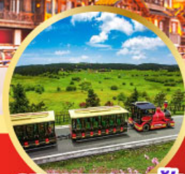
อุทยานเขานางฟ้า