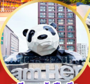
หมีแพนด้าปิ่นตึก