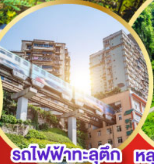
รถไฟฟ้าทะเลตึก หลุมฟ้าสะพานสวรรค์