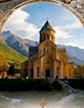
มัทสเคต้า UNESCO HERITAGE