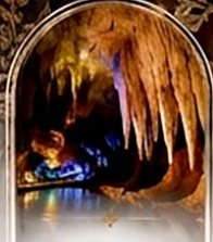
ดำโพรมีรีอุส BOAT RIDE

เดินทางช่วงปีใหม่ 27 ธ.ค. - 3 ม.ค. 70 ราคาเพียง 75,989 บาท / ท่าน