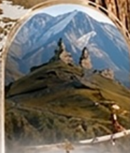
คาสเบกี 4WD EXPERIENCE