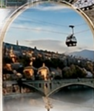
ทบิลีซี OLD TOWN