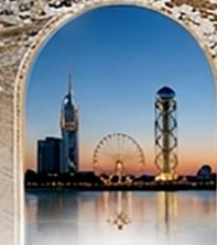
บากูมี BLACK SEA BOULEVARD