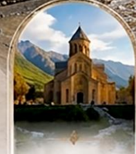
มัทสเคต้า UNESCO HERITAGE