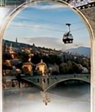
ทบิลีซี OLD TOWN