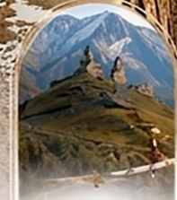
คาสเบก 4WD EXPERIENCE