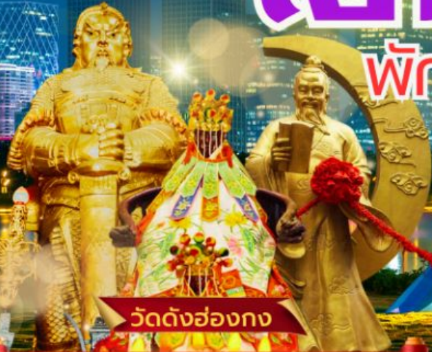
วัดดั่งฮ่องกง