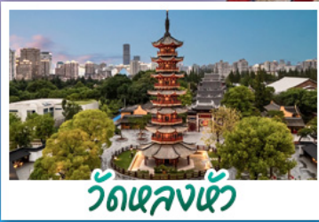
วัดหลงเซ้า