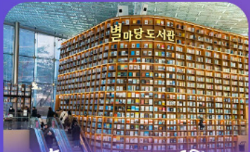
ห้องสมุดดิสตาร์ฟิลด์

เก็บทุกไฮไลท์ ในกรุงโซล ตั้งแต่ความงดงามของ พระราชวังเคียงบ็อก ชมวิวสุดอลังการที่ ดึงลิอเต้ โซลสกาย (รวมค่าลิฟต์ขึ้นดึก) สนุกสุดมันส์ที่ สวนสนุกลิอเต้ เวิร์ล (รวมค่าบัตรเครื่องเล่น) เพลิดเพลินไปกับโลกใต้ทะเล ลีอเต้ อควาเรียม (รวมค่าบัตรเข้าชม) เช็กอินแลนด์มาร์กสุดฮิตอย่างห้องสมุดสตาร์ฟิลา โคเอกมอลล์ เดินเล่นย่านฮิป บริกลินเกาหลี ของชูดง และช้อปปิ้งซัมเมอร์ชิล สูดฟิน ย่านเมียงดงและฮงแด