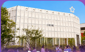
บรูทักไลน์เกาหลี่