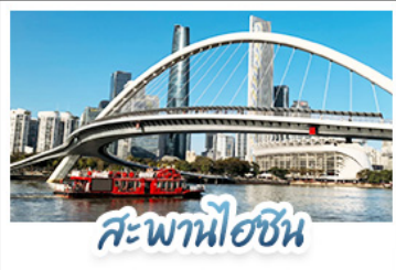
สะพานไฮซิน