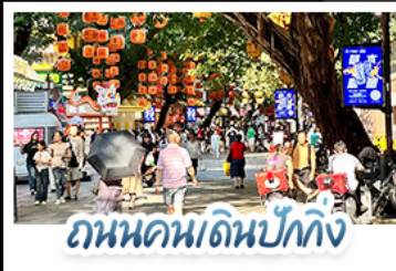
ถนนคนเดินปี้ก้ท้ง