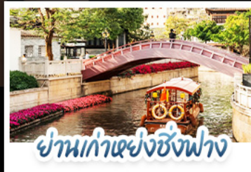
ย่านเก่าแห่งซิ่งฟง