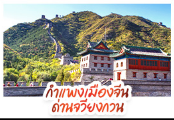
กำแพงเมืองจีน ด่านจวิ๊ยกวาง