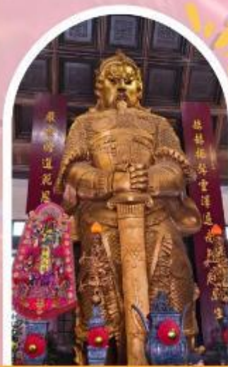
วัดแชกง ขอพรโชคลาก การเงิน และธุรกิจ