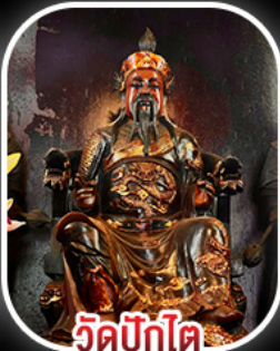
วัดปิกไค