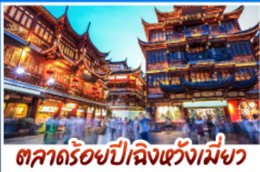
ตลาดร้อยปีเมืองเซี่ยงไฮ้