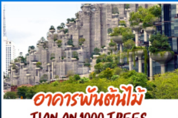
อาคารพันต้นไม้อาณาจักร TIAN AN 1000 TREES