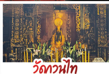
วัดกวนไท้