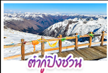
ต้ากู่ปิงชวณ