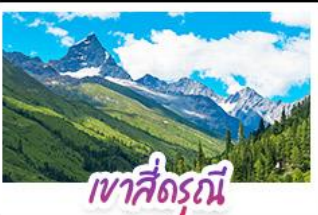
เขาสี่ดรุณี