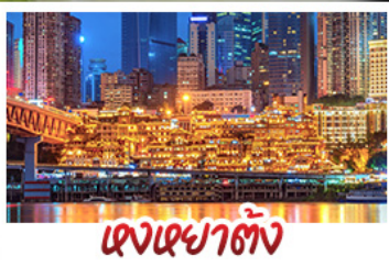
แสงเซาตั้ง