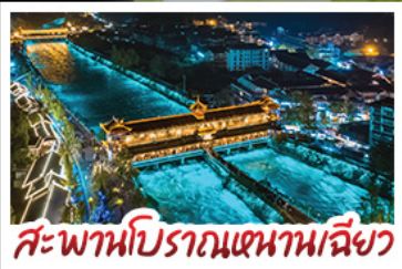
สะพานโบราณเขานางฟ้า