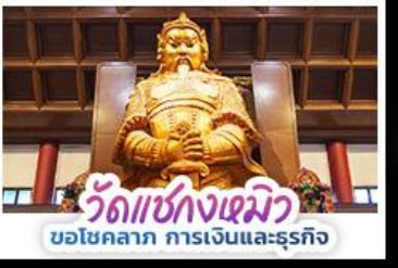
วัดเซ่งกงเซมิว ขอโชคกลาง การเงินและธุรกิจ