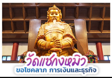
วัดแห่งงเมียว บ่อโชคลาภ การเงินและธุรกิจ