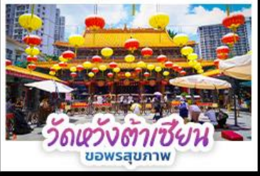
วัดเซ่งต้าเซียง บอพรสุภภาพ