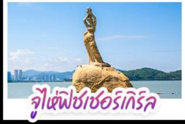
จูเซีฟิซเซอร์ทึกรึค