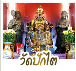
วัดป้กั๊ต