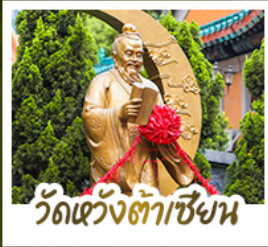
วัดเว่งต่าเซียงน