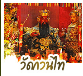
วัดกวนี่ไท