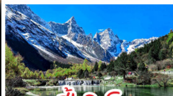
ป่าผึ้งโกว