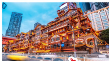
ตึกเซาตัง

อุทยานหลุมบ่อฟ้า - อุทยานเทานางฟ้า หงหยาดัง - นังรถไฟทะเลสาบ - อุทยานสี่ดรุณี ป่าผึ้งโกว - สะพานหนานเฉียว