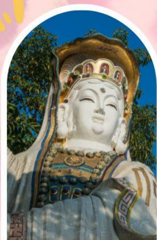
ริพัลลภย์ รับพลังงานดี เสริมพลังดวงจัญ