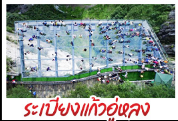
ระเบียงแก้วอุ้งหลง