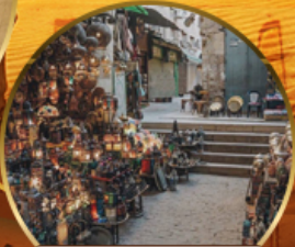
ตลาดบ้านเอลคาลิ