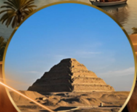
พีระมิดบันบันโต