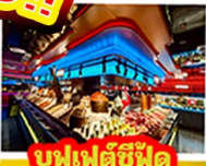
บุฟเฟต์ซีฟู้ด