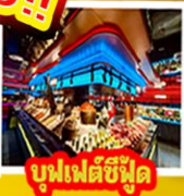
บูฟเฟต์ซีฟู้ด