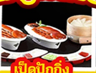
เปิดบักกิ้ง