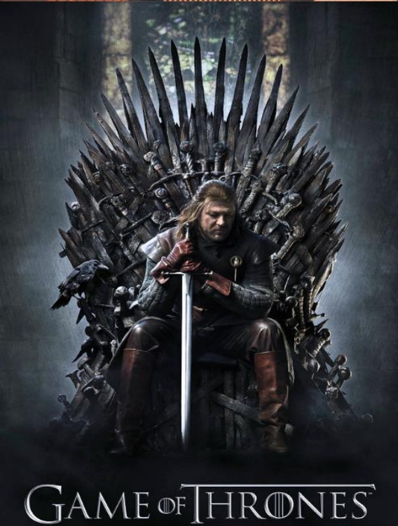
GAME OF THRONES